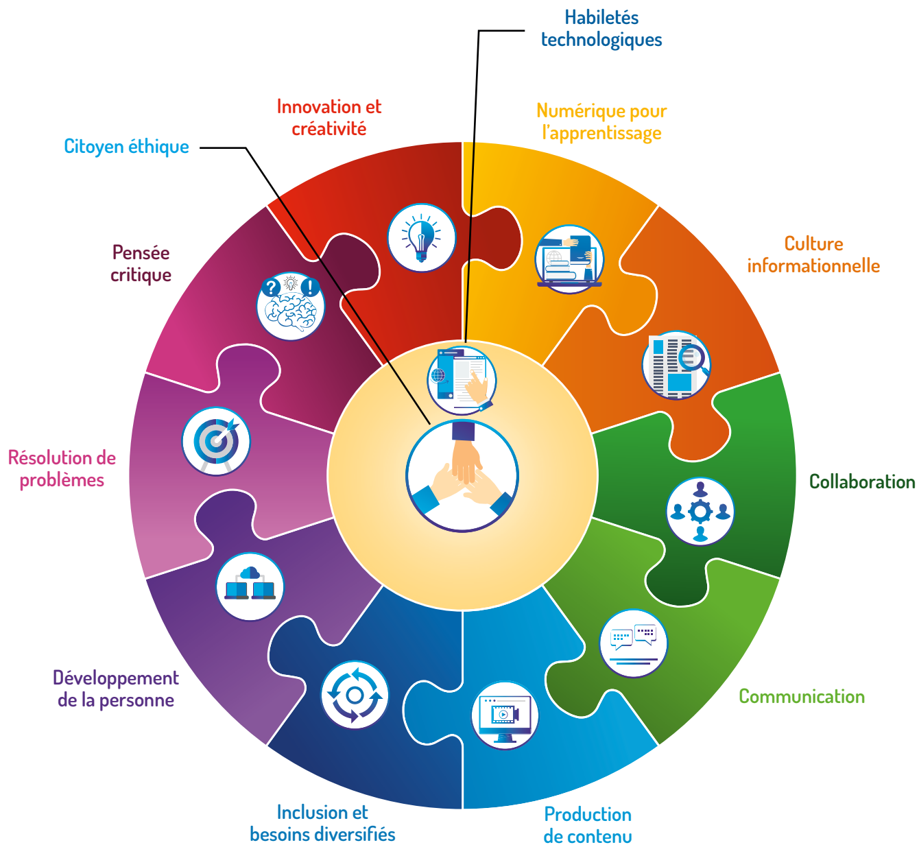
Figure 1 : Représentation graphique du Cadre de référence de la compétence numérique